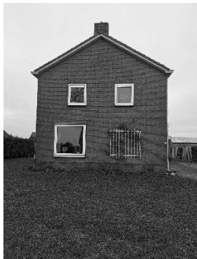
Aletta Schotanus nei Lyklamawei 13